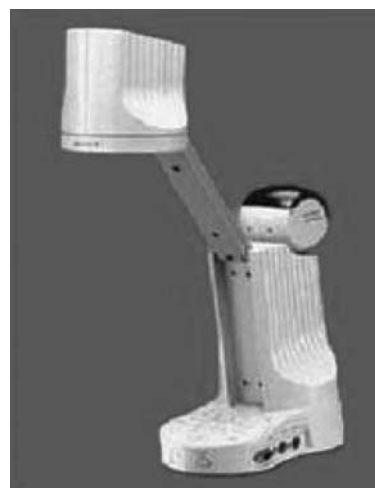
Slika 1. – Link kamera i PC konvertor Sony, za prikazivanje dokumenata

Paralelno tome, razmena podataka van lanca (gde se stvaraju posebno usmereni Internet pozivi) ima korist od povećanja interaktivnosti unutar održavanja širine opsega mrežnih putanja korišćenih za videokonferencijske signale i podatke. To je neophodno radi što vernijeg toka videokonferencije u realnom vremenu i radi verodostojnije interakcije u komunikaciji.