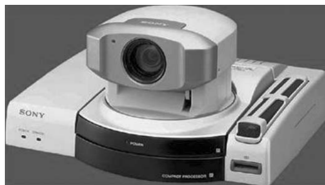
Slika 3. – Videokonferencijska kamera Sony Contact 1600

Mogućnosti ovakvih gateway olakšica su značajne ali zahtevne i njihova integracija u Internet sadržaj servisa za isporuku će se dalje razvijati. Glavna akcija će biti preuzeta kada digitalna TV bude spremna da postane deo procesa javne i privatne poslovne komunikacije kao i isporuke edukacionog materijala.