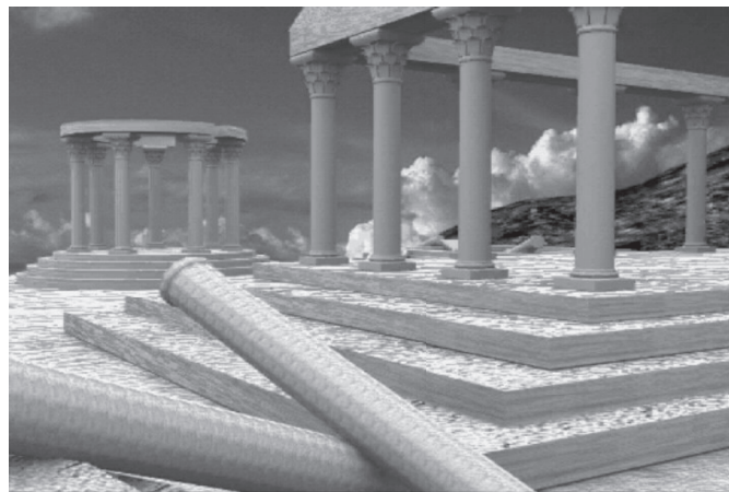
Slika 3. – Detalj prizora iz mašte (kompleks antičkih hramova modelovan u programu 3ds max)

Još slobodnije rečeno, kada se planira virtuelna šetnja po kompleksu iz mašte dozvoljeni su nestvarni zahvati poput totalne egzibicije kreatorove maštarije i igre modelovanja, što unosi sasvim novu dimenziju u animaciju i neosporno na taj način, 3ds max projektima postavljenim na Webu daje efekat čarolije, što je prevashodna ideja i blagonaklona preporuka samog autora ovog rada, a možda i formula uspešnog modelovanja u programu 3ds max.