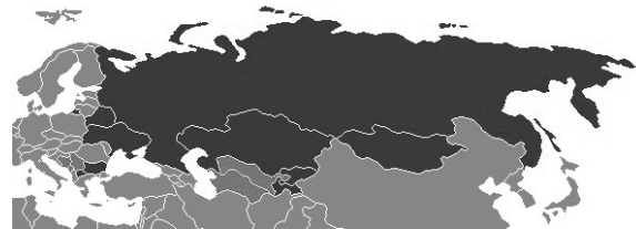
Слика 2. Распрострањеност ћирилице данас [5]

Из свега предходно приказаног може се „извести поуздан закључак да је ћирилица евро-азијско писмо“. [6]