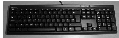
Слика 5. Тастатура са српском азбуком

шеструко заступљенија од осталих. Гајева латиница лажно задовољава услове локализације на српски језик јер не подржава ћирилицу, већ се куцају еквивалентна слова уз додатак да слово „q“ замењује „љ“, слово „w“ замењује „њ“ и слово „x“ замењује „џ“. Не постоји обавеза увозника да локализују тастатуре на ћирилично писмо, иако таква операција је веома јефтина (десетак ситних налепница).