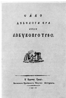
Слика 1. Насловна страна Мркаљеве књижице

Први покушај реформе писма је у време барока предложио Гаврило Стефановић Венцловић (1680. — 1749.), свештеник и писац, који је писао проповеди на народном језику и превео скоро цело Свето писмо. Предлагао је за употребу три слова у српској ћирилици: ђ, ђ и џ.